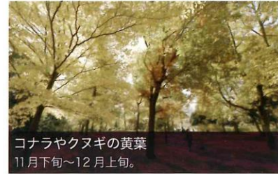
コナラやクヌギの黄葉 11月下旬～12月上旬。